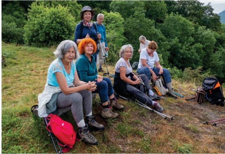
Saccourvielle et Font Blanca...