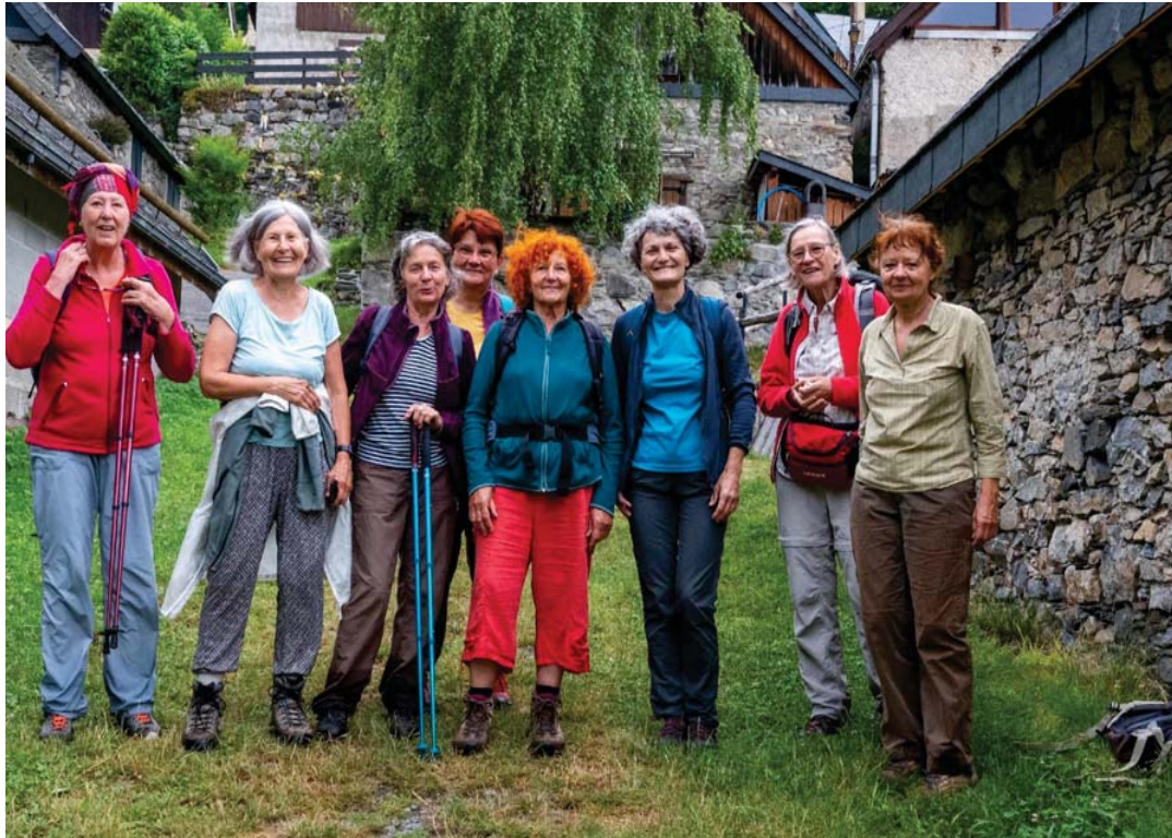
Puis les Granges de Gouron, en passant par le circuit de l'ail des ours