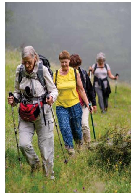
Un tronçon du Luchon - village d'Oô...